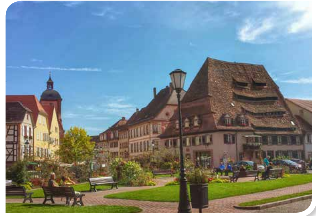
Reizvolles Altstadtflair mit Salzhaus in Wissembourg