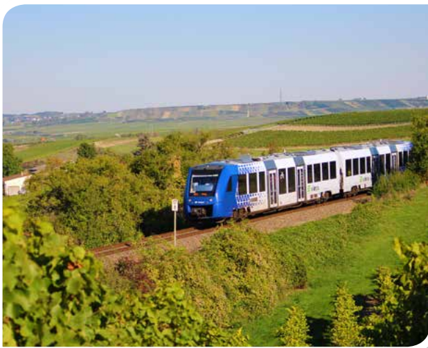
Der Elsass-Express unterwegs in der Nähe von Alzey.

Ebenfalls an Sonn- und Feiertagen in der Freizeitsaison ist der Weinstraßen-Express zwischen Koblenz und Wissembourg unterwegs. Bei der Fahrt durch die sehenswerten Kultur- und Weinregionen Mittelrheintal, Alsenztal und Deutsche Weinstraße lohnt sich stets ein langer Blick aus den Fenstern auf vorbeigleitende Rebenmeere, bis am Ende der Fahrt ein Besuch von Wissembourg lockt.